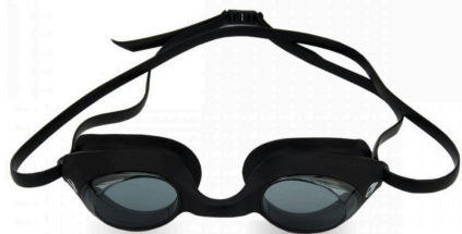
Foto 19 - Óculos para natação.