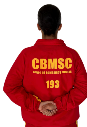
Foto 24 - Agasalho CBMSC