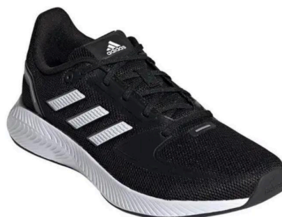
Foto 10 - Tênis para corrida.