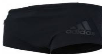
Foto 12 - Sunga masculina na cor preta.