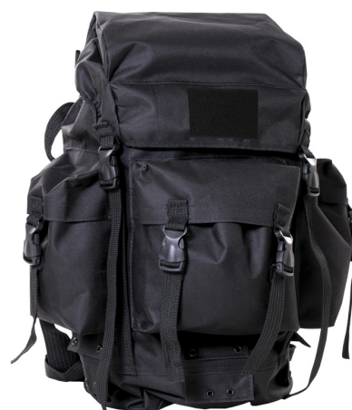
Foto 22 - Mochila cargueira 45 litros preta