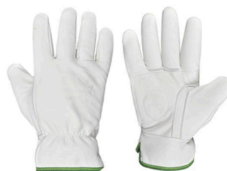
Foto 20 - Par de luvas de vaqueta.