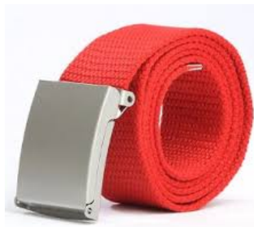
Foto 08 - Cinto lona vermelha com fivela metal prateada.