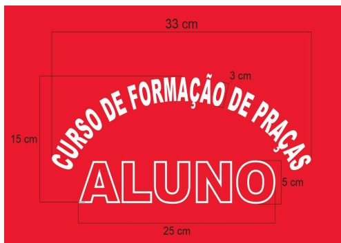
Foto 07 - Serigrafia para as costas das camisetas e moletom vermelho CFP Fonte das letras ARIAL BLACK .