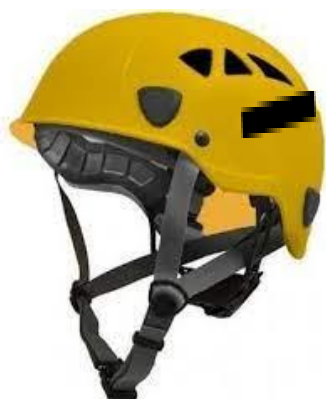
Foto 23 - Capacete de Resgate