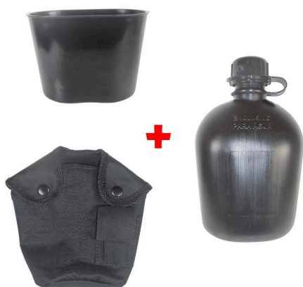
Foto 21- Cantil caneca e capa preta