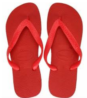
Foto - 09 Par de sandálias na cor vermelha.